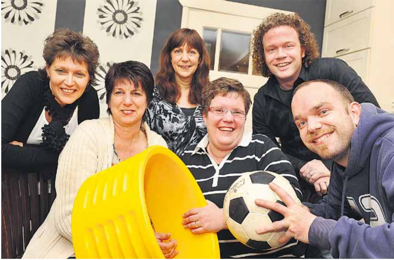
Korfbalvereniging De Issel vierde dit jaar haar 40-jarig jubileum met een groot toernooi in juni.

Het jaar 2011 is bijna weer voorbij, voordat het nieuwe jaar komt, blikken we nog even terug op wat er o.a. in deze krant te lezen was. Misschien bent u het alweer vergeten en frissen wij uw geheugen nog een keer op, zomaar doen we een willekeurige greep uit het afgelopen jaar.